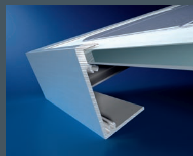
Détail du cadre des séries SMS-1, SMS-2 et SMS-3

Schüco SPV 175-SMS-1 Dimensions : 1.580,4 x 808,4 x 46 mm Puissance nominale ( P_{mpp} ): 175 W p